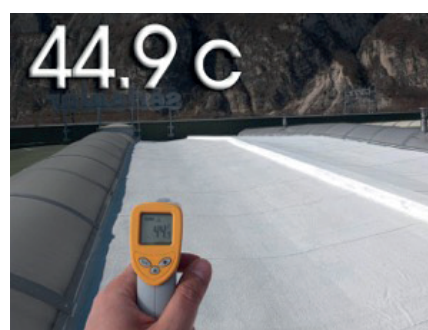
CON RIVESTIMENTO FAST

FAST è un rivestimento acrilico elastomerico a base d'acqua che forma un film bianco elastico dopo la sua essiccazione. Proteggendo gli edifici dal surriscaldamento grazie alle sue potenti caratteristiche riflettenti ed alto emissive, e permette di allungare la longevità delle coperture.