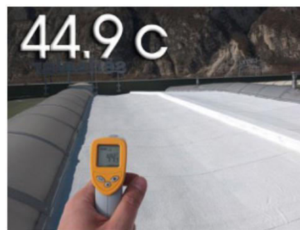
CON RIVESTIMENTO FAST 2018

FAST 2018 è un rivestimento acrilico elastomerico a base d'acqua che forma un film bianco elastico dopo la sua essiccazione. Proteggendo gli edifici dal surriscaldamento grazie alle sue potenti caratteristiche riflettenti ed alto emissive, e permette di allungare la longevità delle coperture.